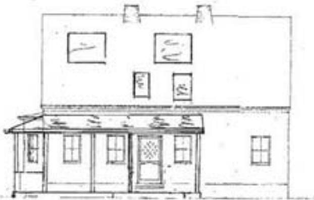
Süd-Ost-Ansicht: Hauseingang Garten-Ansicht